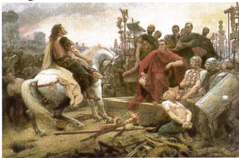
Vercingétorix jette ses armes devant César, L.Royer (1888)