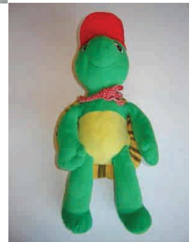
La tortue ↴