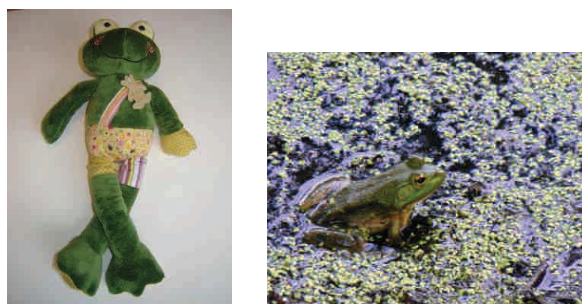
Une grenouille ↑