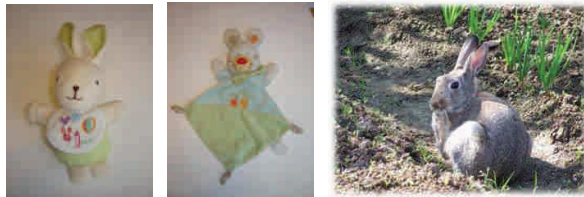
Les lapins ↑