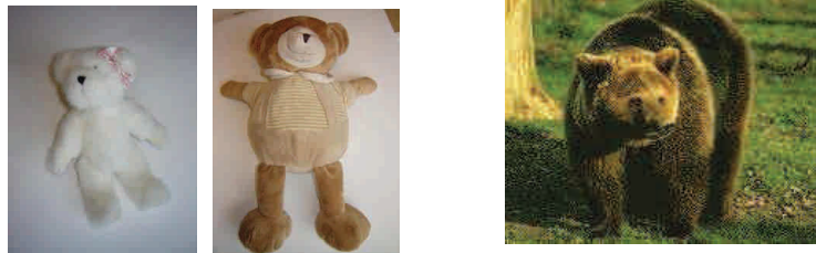
Les ours ↓

Un intrus dans cette collection d'animaux