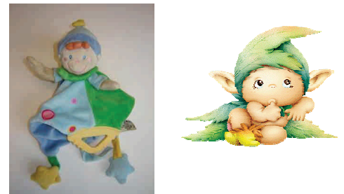
Le lutin ↑

Un intrus dans cette collection d'animaux