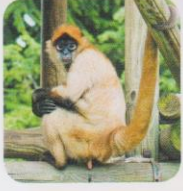
Atèle 7 kg

5 PROBLÈME a. Classe ces singes du plus lourd au plus léger.