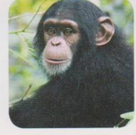
Chimpanzé 50 kg