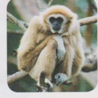
Gibbon 11 kg