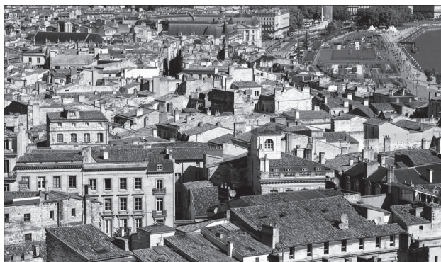
Doc. 1 Le quartier du centre-ville.