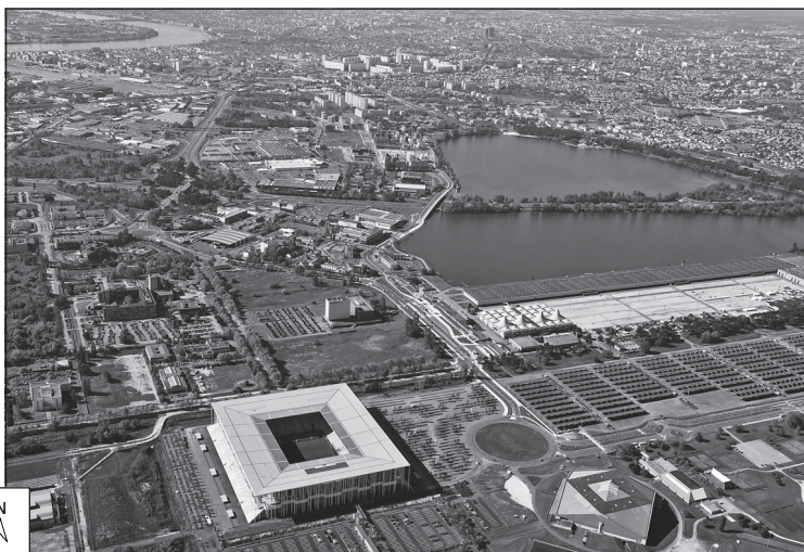
Doc. 2 Le quartier de Bordeaux-Lac, sur la rive gauche de la Garonne, au nord de la ville.