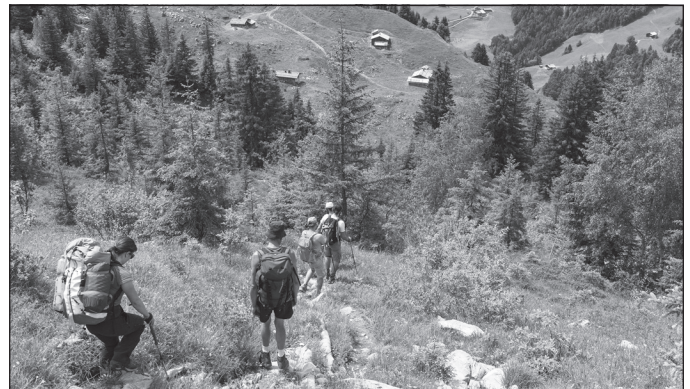
Doc. 2 La Clusaz, l'été.