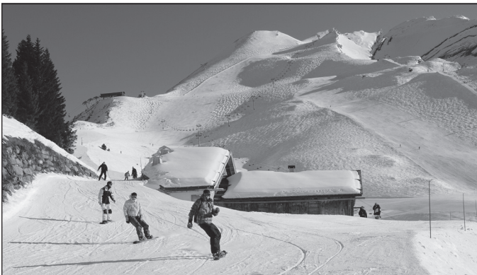
Doc. 1 La Clusaz, l'hiver.

Je découvre différents espaces touristiques.