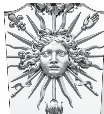
Doc. 4 Motif sur la grille d'enceinte du château de Versailles.