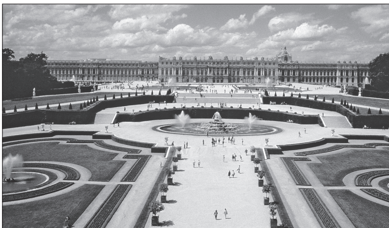
Doc. 2 Le château de Versailles et ses jardins.