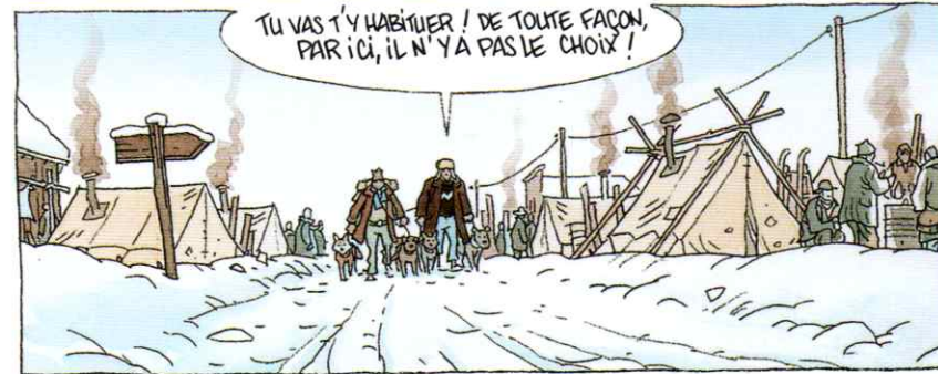
TU VAS T'Y HABITUER ! DE TOUTE FAÇON, PAR ICI, IL N'Y A PAS LE CHOIX !