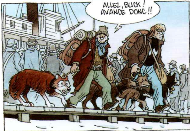
ALLEZ, BUCK ! AVANCE DONC !!