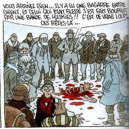
VOUS ARRIVEZ BIEN ... ILY A EU UNE BAGARRE ENTRE CHIENS, ET CELUI QUI ÉTAIT BLESSÉ S'EST FAIT BOUFFER PAR UNE BANDE DE HUSKIES !! C'EST DE VRAIS LOUES CES BÊTES-LÀ ...