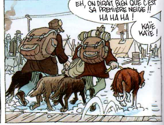
EH, ON DIRAIT BIEN QUE C'EST SA PREMIÈRE NEIGE !! HA HA HA !