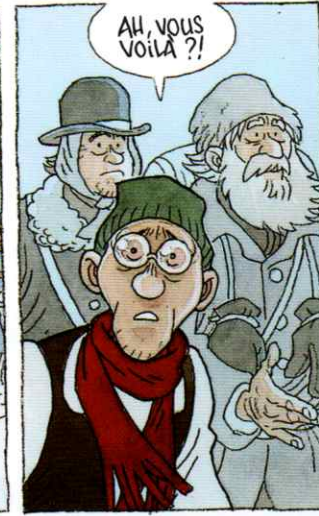
AH, VOUS VOILÀ ?!