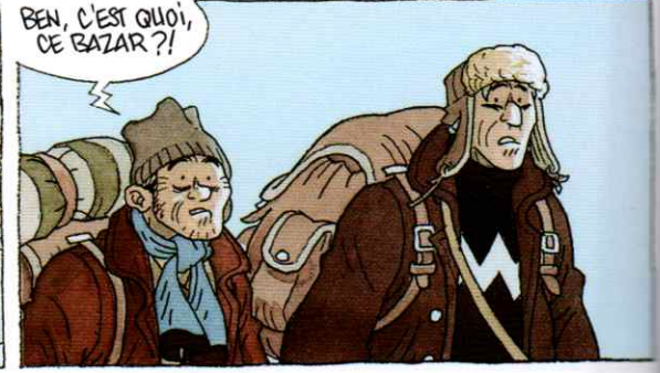
BEN, C'EST QUOI, CE BAZAR ?!