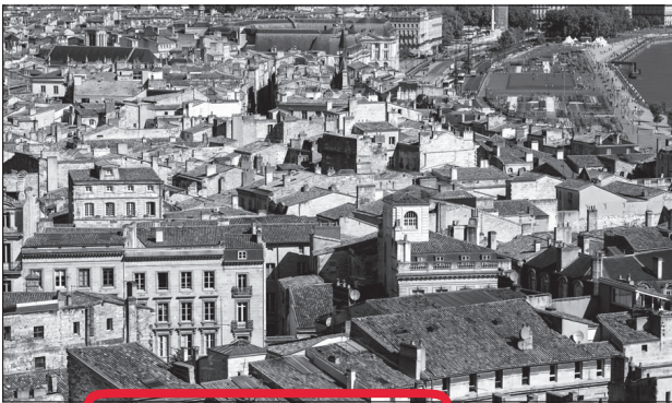
Doc. 1 Le quartier du centre-ville.