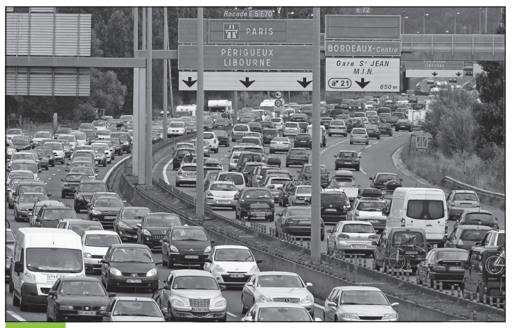
Doc. 5 Les embouteillages à Bordeaux.

D'après un article de Sud-Ouest , 29 octobre 2011.