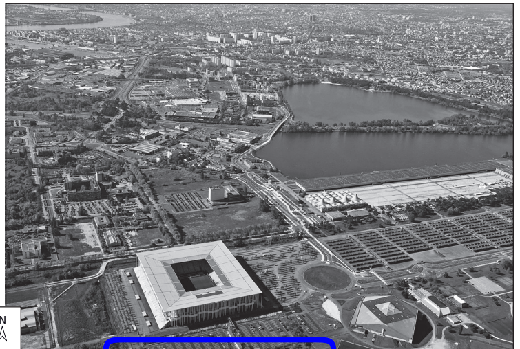
Doc. 2 Le quartier de Bordeaux-Lac, sur la rive gauche de la Garonne, au nord de la ville.