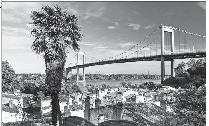
Doc. 3 La commune de Lormont sur la rive droite de la Garonne.

1. Repère sur la carte les emplacements des trois photographies et colorie-les