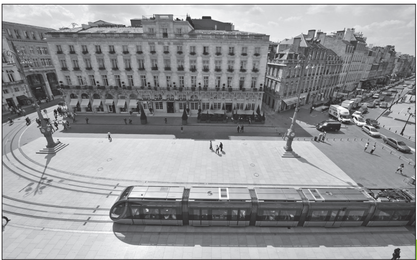
Doc. 6 Le tramway à Bordeaux.