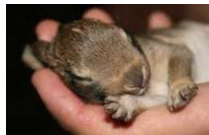
à une semaine