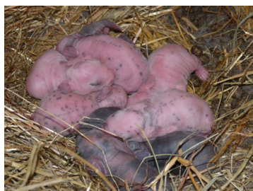
à la naissance

Les lapins se reproduisent beaucoup, une femelle peut faire jusqu'à 50 petits par an. Le lapin est vivipare (vivipare veut dire que les bébés sont dans le ventre de la maman). La gestation (gestation veut dire grossesse) dure entre 31 et 32 jours. Les bébés naissent sans poils, les yeux et les oreilles fermés et ils pèsent entre 30 et 80 grammes. Chez les races naines, il peut y avoir 4 à 5 bébés et chez les races moyennes 8 à 12 bébés par naissances.