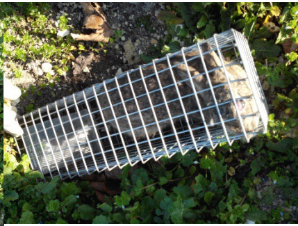
Le lapin est dans la cage