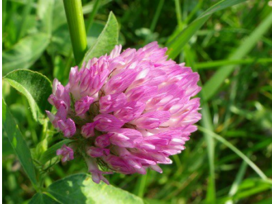
Fleur de trèfle

Le lapin est herbivore, il mange de l'herbe tendre, des fleurs de trèfle, de la luzerne ... Il aime aussi les graminées cultivées comme le blé, l'orge et l'avoine.