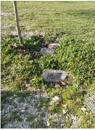
Installation des cages