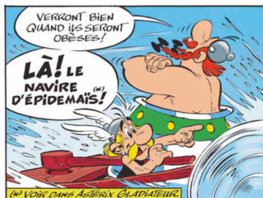
ASTERIX® - OBELIX® - IDEFIX® / © 2022 LES ÉDITIONS ALBERT RENÉ