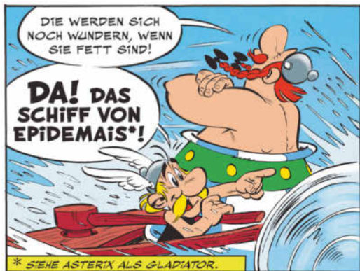
Extrait de l'album La Fille de Vercingétorix