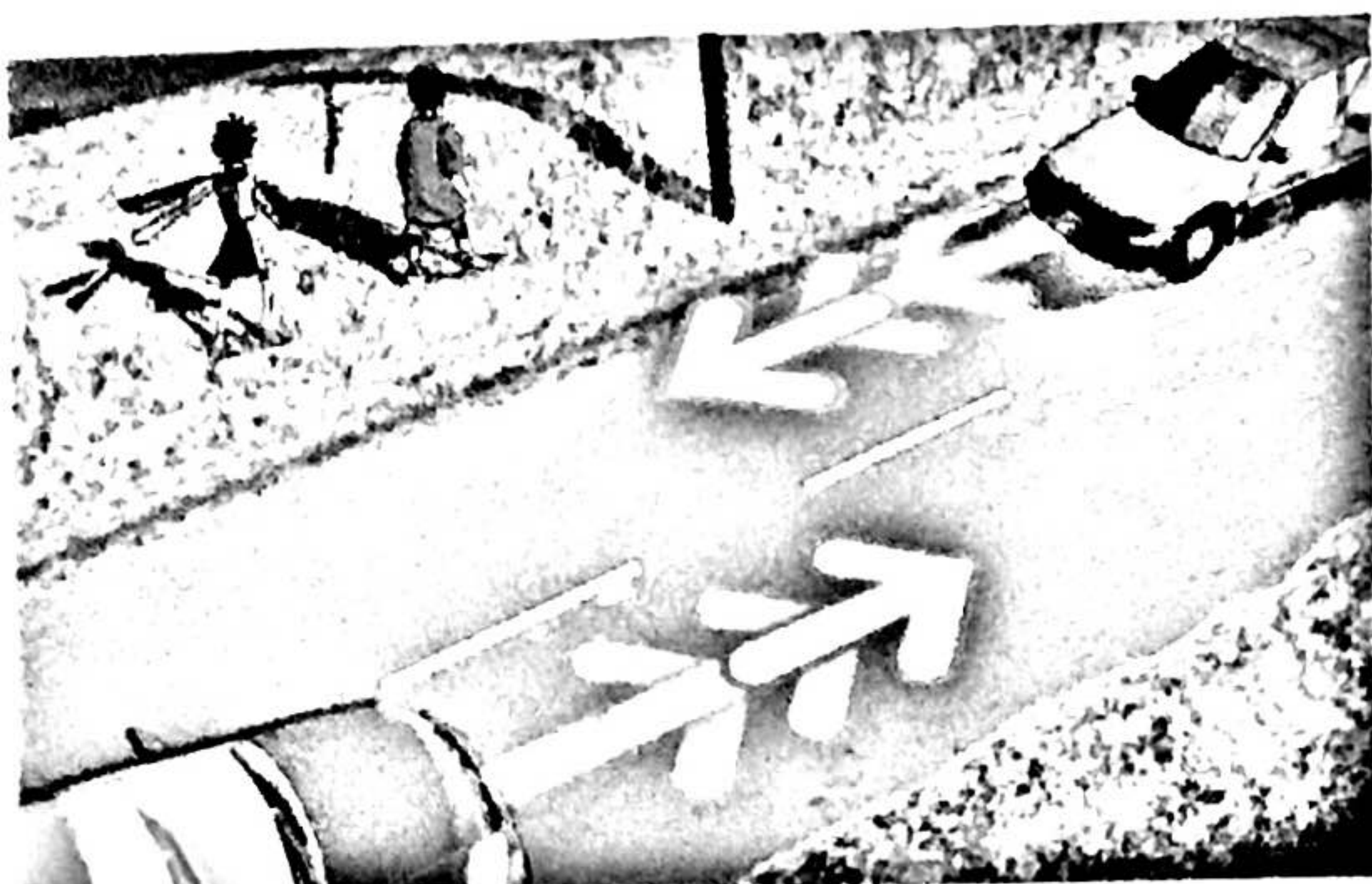
Tu marches à gauche.

Tu dois bien voir, bien entendre et être bien vu